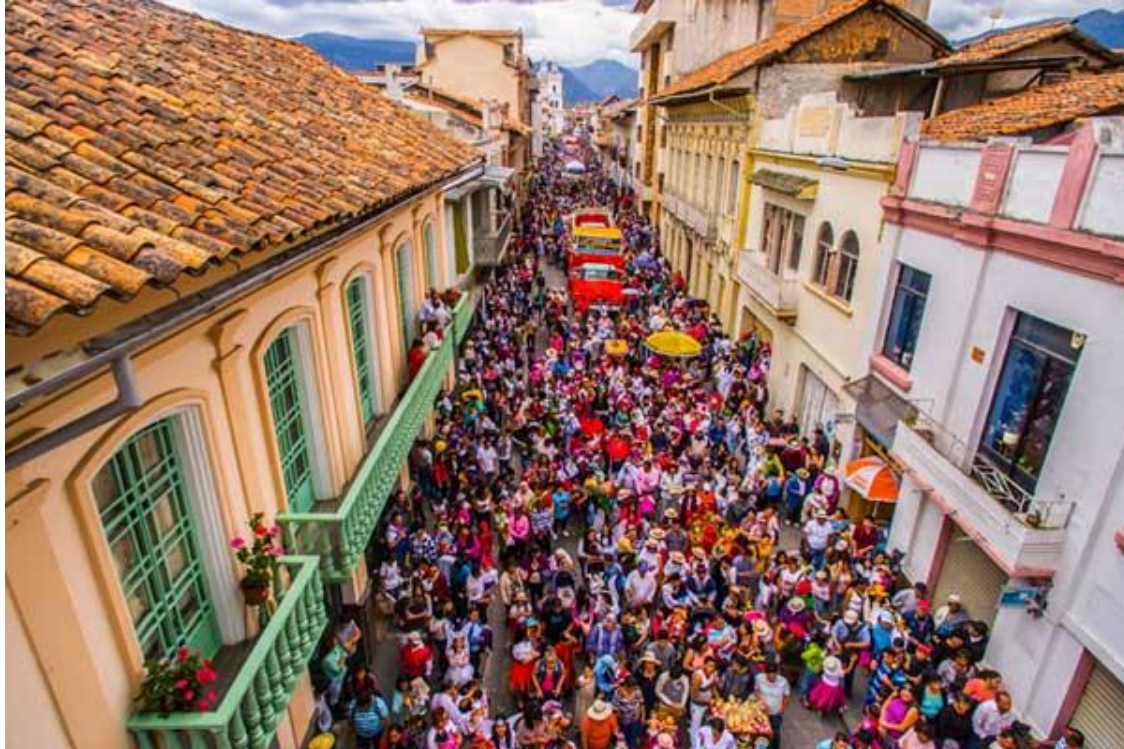
Figura 1.2. Representación de la fiesta patrimonial del pase del niño Viajero

Nota: La figura muestra a representantes que desfilan en la Ciudad de Cuenca, capital de la provincia de azuay por la conmemoración de la fiesta Patrimonial del Pase del Niño Viajero. Adaptado de Alcaldía de Cuenca (2017), características de la fiesta del Pase del Niño Viajero . Retrieved Diciembre 12, from Fundación Nacional Turismo Para Cuenca web site: www.cuencaecuador.com.ec