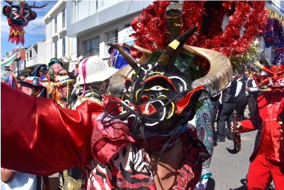
Figura 1.6. Representación de la fiesta patrimonial de la Diablada Pillareña

Nota: La figura muestra a un representante disfrazado de diablo, es uno de los miles que desfilan con máscaras de características similares por las calles de Pillaro, ciudad ubicada en la Provincia de Tungurahua. Adaptado de Ministerio de Turismo (2017) disfraz característico de los Diablos de Pillaro . Retrieved julio 10, 2018, from Ministerio de Turismo Web Site: www.turismo.gob.ec .