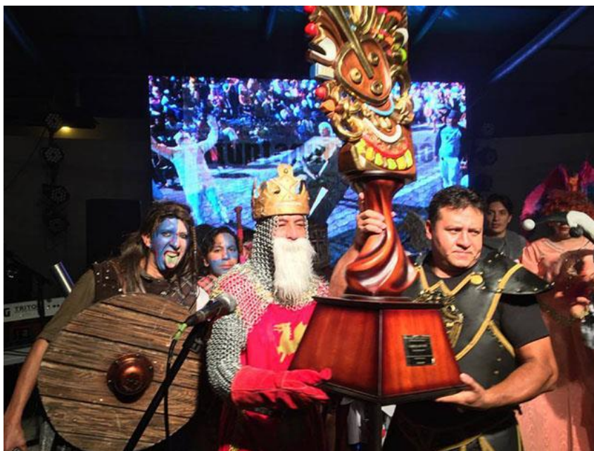
Figura 1.4. Representación de la fiesta patrimonial de Inocentes y Fin de Año

Nota: La figura muestra a participantes en la ciudad de Atuntaqui después de la condecoración de las delegaciones ganadoras por la creación de monigotes, calificando la jocosidad de las representaciones. La ciudad se encuentra en la Provincia de Imbabura que da lugar a la fiesta Patrimonial de Inocentes y Fin de Año. Adaptado de Gad Antonio Ante (2016) condecoración efectuada por el gobierno autónomo descentralizado de Antonio Ante . Retrieved julio 10, 2018, from Gad Antonio Ante web site: www.antonioante.gob.ec .