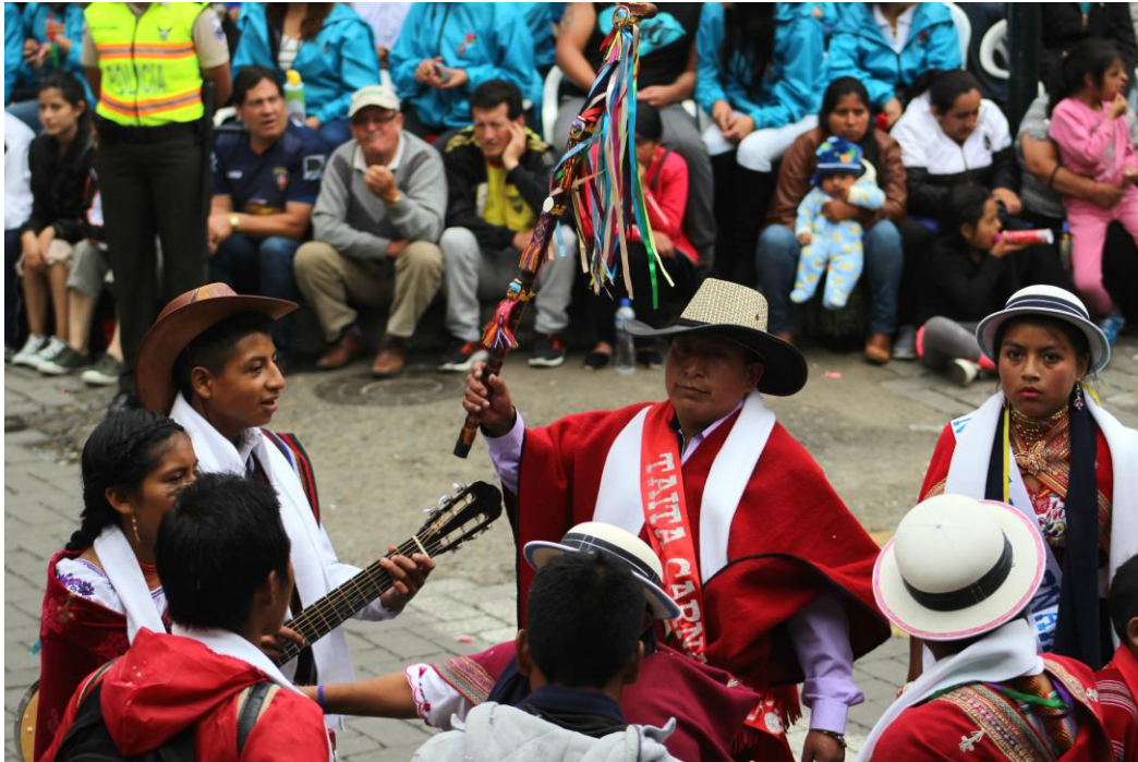
Figura 1.8. Representación del Carnaval de Guaranda

Nota: La figura muestra a un grupo de músicos, los cuales son una parte de la gran variedad que demuestra la ciudad de Guaranda, capital de la provincia de Bolívar. Adaptado de Ministerio de Turismo (2017) participantes del Carnaval de Guaranda Ministerio de turismo. Retrieved julio 10, 2018, from Ministerio de turismo. web site: www.turismo.gob.ec