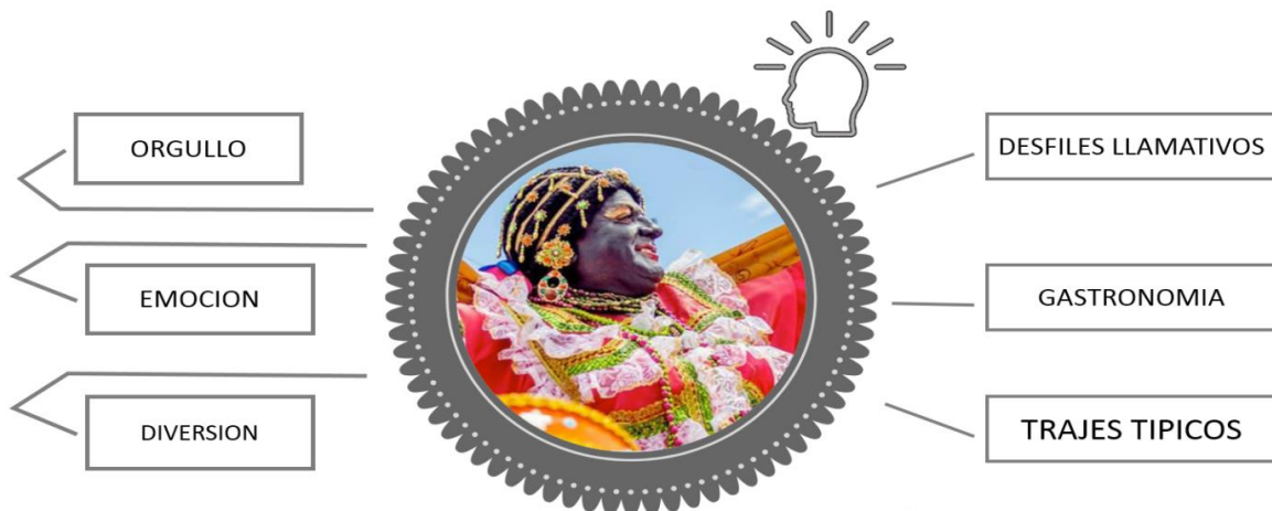
Figura 5. La figura muestra como festividad patrimonial más reconocida por visitantes nacionales a la fiesta de la Mama Negra de la ciudad de Latacunga con los principales atributos con la que la asocian. Elaboración propia.