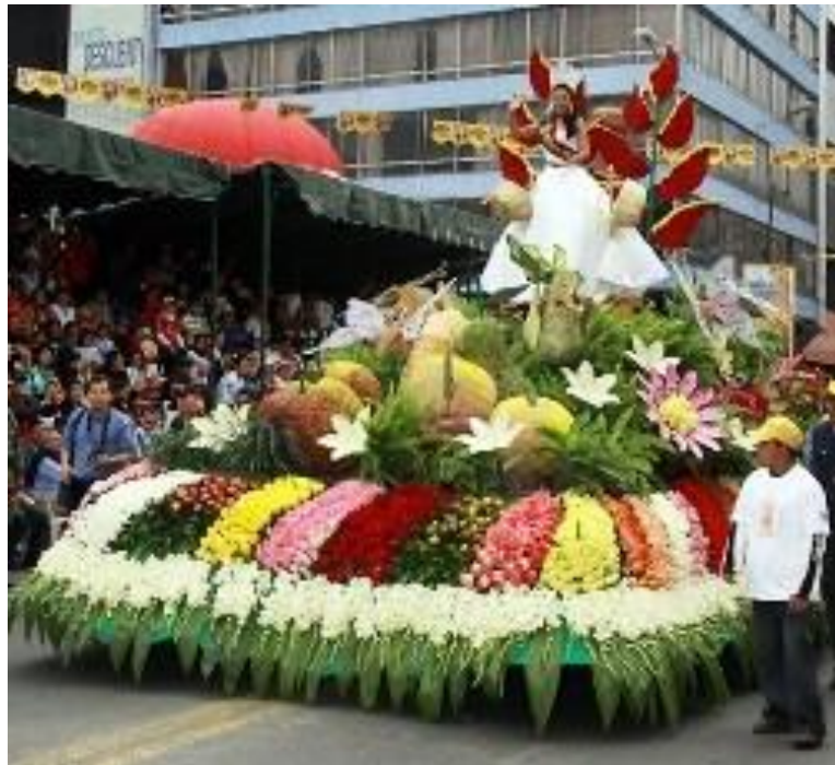
Figura 1.5. Representación de la fiesta patrimonial de las Flores las Frutas.

Nota: La figura muestra una representación de la riqueza de la ciudad de Ambato mediante un carro alegórico adornado completamente por flores. La ciudad se encuentra en la Provincia de Tungurahua que da lugar a la fiesta Patrimonial de Las Flores y Las Frutas. Adaptado de Ministerio de Turismo (2017) reina electa de la ciudad de Ambato siendo llevada en un carro alegórico. Retrieved julio 10, 2018, from Ministerio de Turismo web site: www.turismo.gob.ec