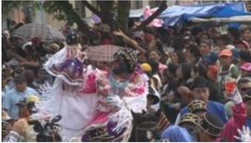
Figura 1.3. Representación de la fiesta patrimonial de la Mama Negra

Nota: La figura muestra a representantes que desfilan por la ciudad de Latacunga, perteneciente a la Provincia de Cotopaxi por la conmemoración de la fiesta Patrimonial de la mama Negra. Adaptado del Ministerio de Turismo (2017) representación de la Mama Negra montada en un caballo . Retrieved Julio 10, 2018, from Ministerio de turismo web site: