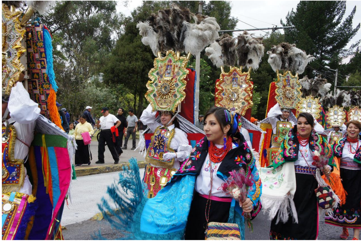
Figura 1.7. Representación de la fiesta patrimonial del Corpus Christi

Nota: La figura muestra parte de los desfiles que se celebran en la ciudad de Pujilí ubicada en la Provincia de Cotopaxi en la cual participan los Danzantes y sus Acompañantes. Adaptado de Ministerio de Turismo (2017) festival del Corpus Christi de la pagina del Ministerio de Turismo . Retrieved julio 10, 2018, from Ministerio de Turismo web site: www.turismo.gob.ec .