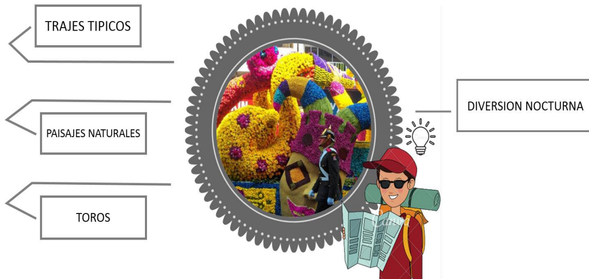
Figura 6. La figura muestra la festividad patrimonial más reconocida por visitantes extranjeros siendo la fiesta de las Flores y las Frutas de la ciudad de Ambato y los atributos con la que la asocian. Elaboración propia.