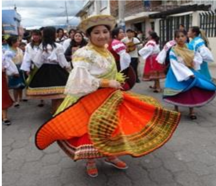
Figura 1.1. Representación de la celebración patrimonial de San Pedro y San Pablo

Nota: La figura muestra una de las participantes de las diversas comparsas que se presentan en la festividad del cantón Pedro Moncayo en la provincia de Pichincha. Adaptado del Ministerio de Turismo (2017) Coreografías participantes de danza autóctona del lugar . Retrieved Julio 10, 2018, from Ministerio de turismo web site: www.turismo.gob.ec .