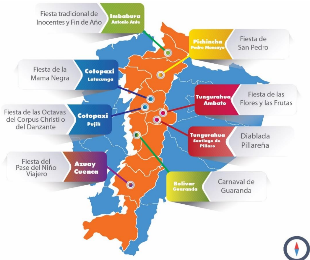
Figura 2. La figura muestra en detalle el mapa político del país en cuya división se puede identificar las diferentes provincias que albergan las diferentes fiestas patrimoniales de la sierra ecuatoriana. Elaboración propia.

El instrumento fue aplicado a una muestra total de 270 participantes de una población de 600000 personas, ésta fue obtenida a partir del número de turistas que visitan las fiestas en mención; la encuesta se aplicó en varias de las locaciones donde se desarrollan las fiestas; la