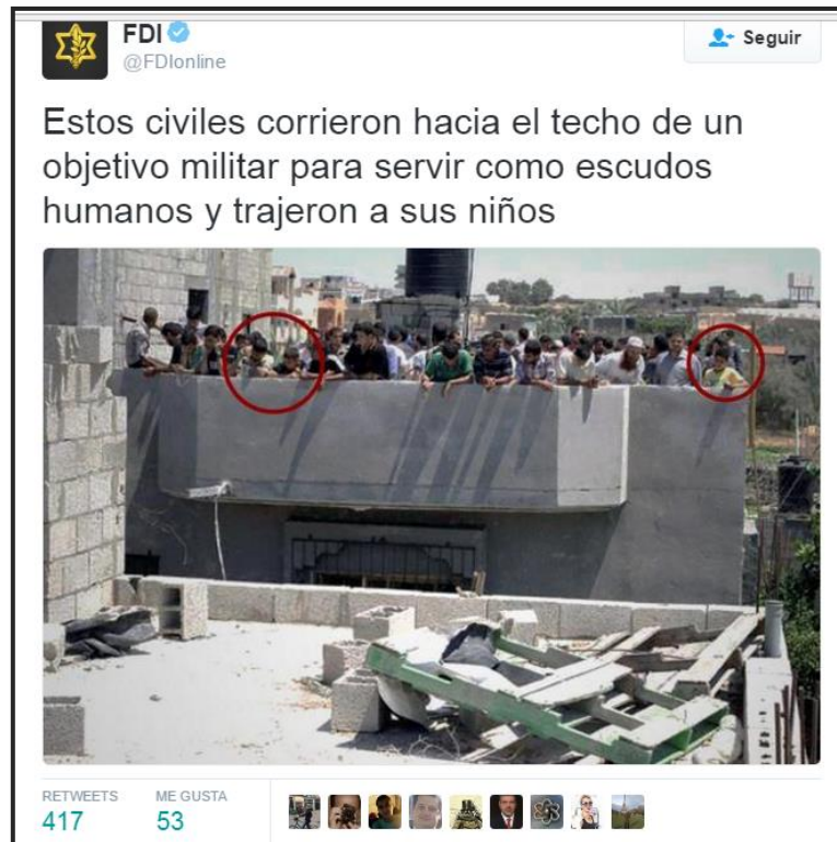
IMAGEN 11. TUIT DE LAS FDI SOBRE EL USO DE ESCUDOS HUMANOS POR PARTE DE HAMAS (FUERZAS DE DEFENSA DE ISRAEL, 2014)

Aprovechando dichas expresiones se incrementaron las actividades en las redes para dejar en evidencia de la exposición de los civiles por parte de Hamás, tal como puede verse en la imagen 11.