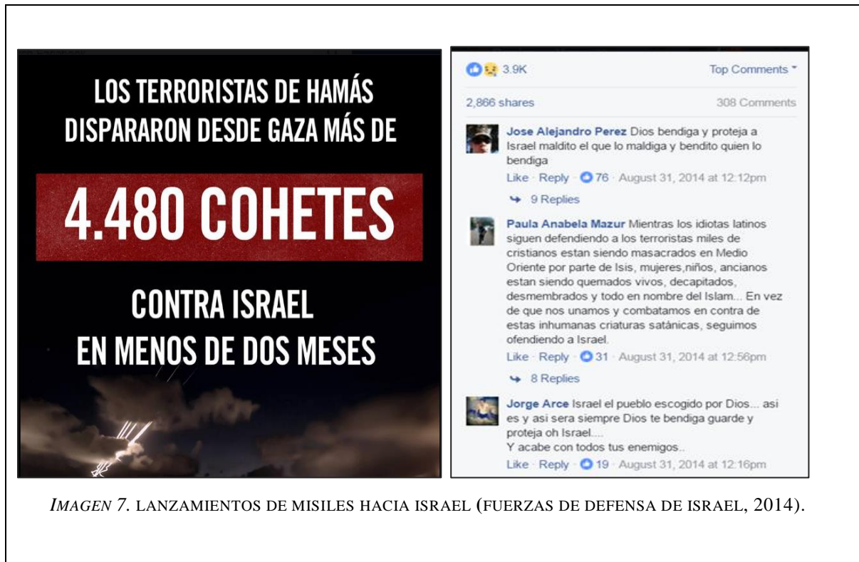
IMAGEN 7. LANZAMIENTOS DE MISILES HACIA ISRAEL (FUERZAS DE DEFENSA DE ISRAEL, 2014).