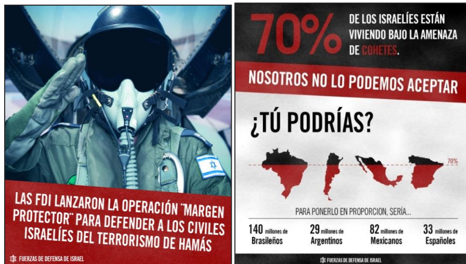
Imágenes 3 y 4 Infografía sobre la amenaza terrorista. (Fuerzas de Defensa de Israel, 2014)

Afectar la seguridad de Israel por medio de ataques hacia el interior del territorio israelí, imponer condiciones de alto el fuego a Israel, y crear un equilibrio de terror y una capacidad de disuasión que impida que el mando militar de Israel optase por una operación terrestre en Gaza (Hatzad Hasheni, 2015, p. 90).