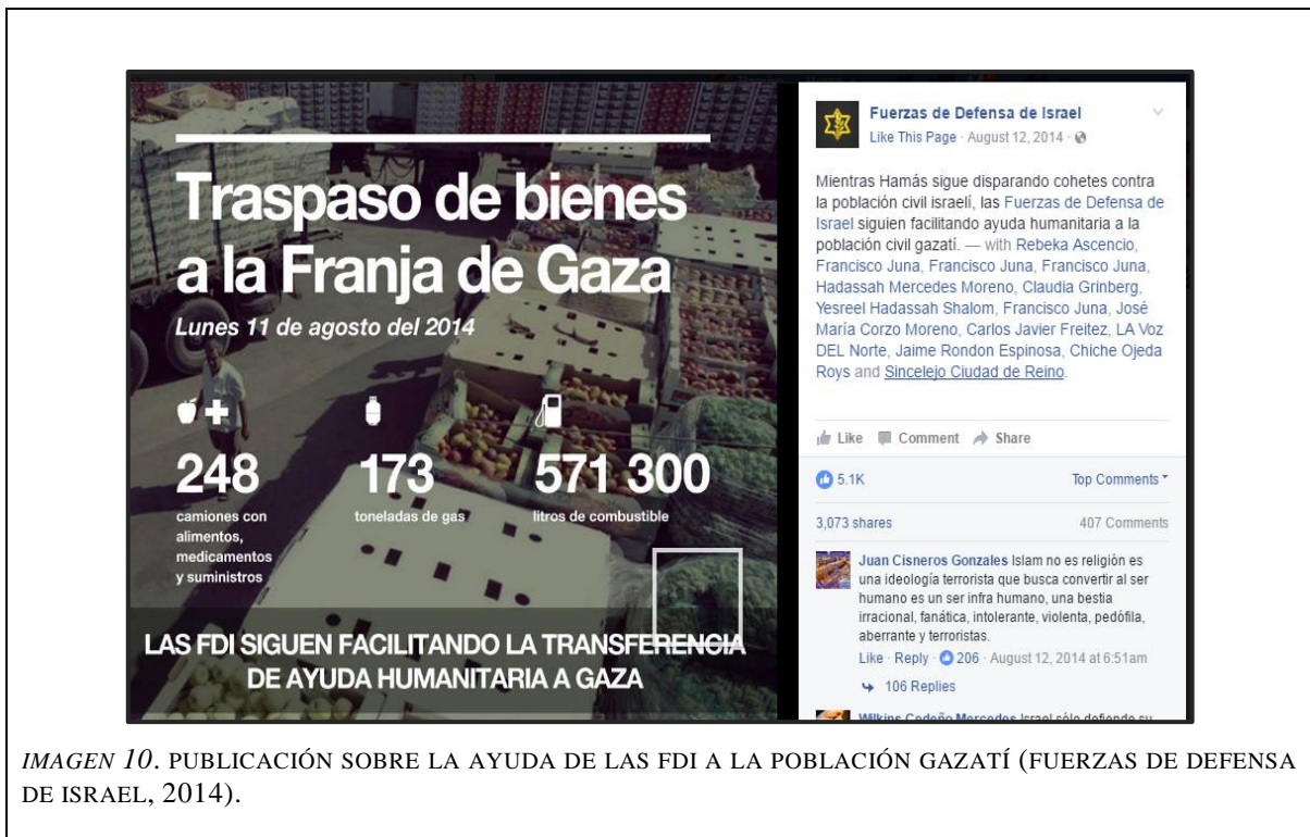
IMAGEN 10. PUBLICACIÓN SOBRE LA AYUDA DE LAS FDI A LA POBLACIÓN GAZATÍ (FUERZAS DE DEFENSA DE ISRAEL, 2014).

el desarrollo de la Operación Margen Protector, Israel, a través de las FDI y COGAT ix , llevaron a cabo una campaña intensiva humanitaria y de amplio alcance destinada a aliviar el sufrimiento y las penurias de la población civil en la Franja de Gaza. Esto fue utilizado también como medio para buscar debilitar la posición de Hamas, tal como se aprecia en la imagen 10. “Mientras Hamás sigue disparando cohetes contra la población civil israelí, las FDI siguen facilitando ayuda humanitaria a la población civil gazatí” .