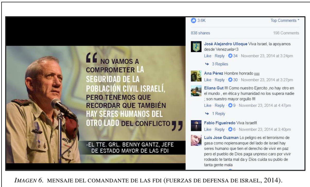
IMAGEN 6. MENSAJE DEL COMANDANTE DE LAS FDI (FUERZAS DE DEFENSA DE ISRAEL, 2014).

Las publicaciones en Facebook eran mensajes acompañados de imágenes emocionales que cumplen con una clara finalidad de sensibilización. Se perseguía proyectar la imagen de que el soldado israelí estaba dispuesto a dar su vida tanto por los civiles israelíes, como por los civiles palestinos de la Franja de Gaza (Rodríguez Fernandez, 2015, p. 473).