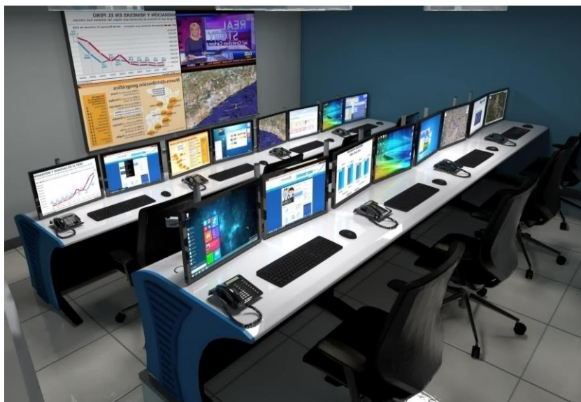
Imagen 1. El campo de batalla del Siglo XXI - Redes Sociales (PROCONT, 2019)

Sin embargo, existe además el riesgo de la infoxicación i , término que define al “ruido” que existe a partir de la abundancia de información inútil y falsa en las plataformas sociales. Por tanto, resultan válidas las palabras de Javier Balaña en su artículo titulado “Rusia, modernización de la Guerra Política Encubierta” ii , cuando expresa que “el problema ya no es la falta de la información, sino es el exceso de la información y especialmente su manipulación”.