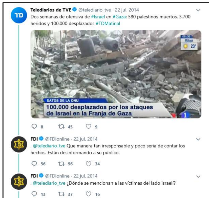
IMAGEN 12. CONFRONTACIÓN DE NARRATIVAS EN TWITTER. (FUERZAS DE DEFENSA DE ISRAEL, 2014).

Sin embargo, las redes sociales fueron un arma de doble filo para las FDI, cuyas consecuencias fueron difíciles de predecir y controlar debido en gran medida, a la disociación entre lo que las FDI informaban y lo que realizaron sus tropas en el terreno. Los intensos bombardeos de áreas densamente pobladas solo provocaron muerte y dolor a cientos de civiles inocentes, por cuanto las primeras intenciones de ganar la opinión pública se diluyeron ante la cruda realidad que difundía en cada una de las plataformas sociales y medios de comunicación. El impacto en las redes fue mensurable, en la red social Twitter, bajo la etiqueta “#GazaUnderAttack” (Gaza bajo ataque) aparecieron en algo más de cuatro millones de tuits en un periodo de treinta días, mientras que su réplica israelí, “#IsraelUnderFire” (Israel bajo fuego) en una cantidad de trescientos mil (Blanco, 2014, p. 2). Por ello y en base a ciertas mediciones de actividad en las redes y pese al despliegue en las redes sociales de las FDI se puede afirmar que los palestinos lograron una mayor actividad en las redes y una mayor cercanía con la opinión pública que los israelíes.